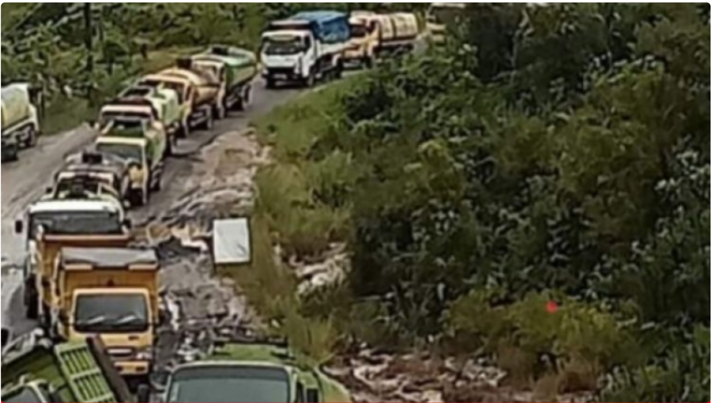
Gambar Saat Kondisi Jalan Kuala Kurun Gunung Mas

PALANGKA RAYA - Keprihatinan masyarakat Kabupaten Gunung Mas (Gumas) terhadap infrastruktur jalan yang selama ini mereka gunakan dalam aktivitas sehari - hari, belum lah selesai seperti apa yang diharapkan selama ini.